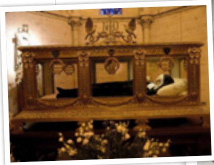
Sainte Bernadette à Nevers.

Tous, je crois, nous revenons avec le désir de repartir et de vivre encore cette richesse. Donc nous comptons bien sur l'épisode 2018 encore plus nombreux.