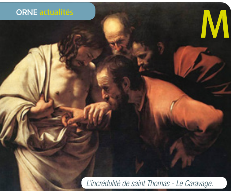
L'incrédulité de saint Thomas - Le Caravage.

Et pourtant, le monde fête chaque année bruyamment à Noël, sans peut-être le réaliser, l'inouï d'un Dieu qui s'est abaissé à entrer dans le temps, en un corps humain fragile et limité. Ce Jésus que nous voulons suivre, c'est par un corps humain que, tout au long des évangiles, il se fait reconnaître ou rejeter, qu'il enseigne, marche, mange, dort... C'est un corps d'homme fatigué et assoiffé qui, près du puits de Jacob, interpelle la Samaritaine ; ce sont des pieds marqués par des kilomètres de marche que la femme pécheresse recouvre d'huile parfumée ; c'est avec une taille et une voix sans doute ordinaires que, pour se faire