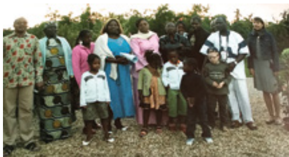
La famille camerounaise avec qui les propriétaires du gîte ont lié amitié.

Aujourd'hui, l'environnement devient la condition essentielle lors d'une location. Être loin du bitume, des bruits incessants des voitures avec la pollution. Beaucoup de vacanciers nous disent avoir été réveillés par le silence. Un réel dépaysement. Ce silence recherché dans nos belles abbayes ou lors d'une marche vers le Mont-Saint-Michel ou Saint-Jacques de Compostelle.