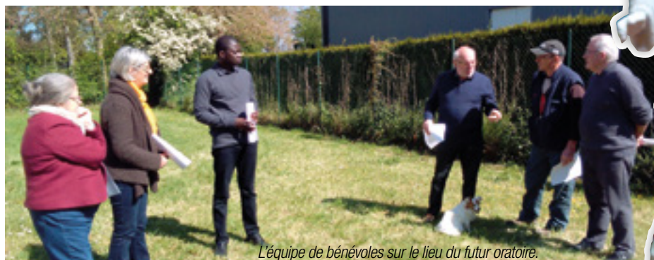
L'équipe de bénévoles sur le lieu du futur oratoire.

Nous faisons appel à la mémoire des anciens vimonastériens qui auraient connu l'oratoire de l'espace Rebmann de longue date afin de pouvoir retracer son histoire. Merci de s'adresser à l'auteur de cet article ou à la maison paroissiale. merci de bien vouloir donner vos coordonnées à la maison paroissiale.