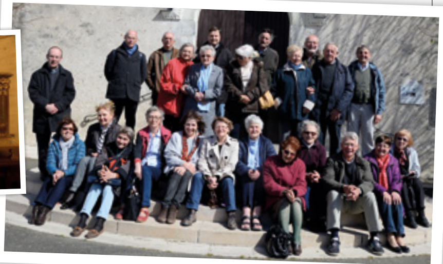
Groupe pèlerins du pôle missionnaire du pays d'Auge.