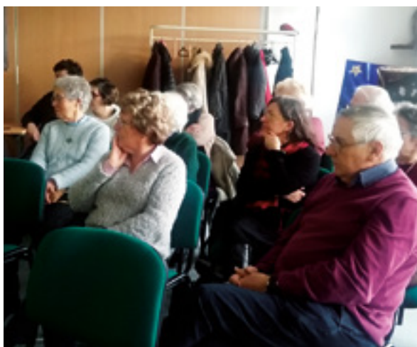
La projection du film.