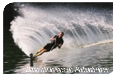
Base de loisirs de Rabodanges