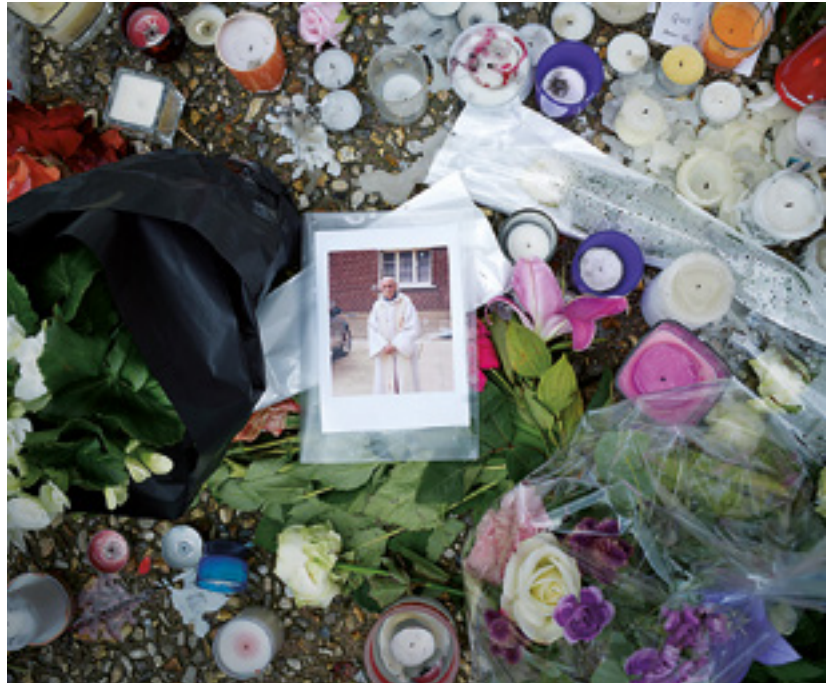
29 juillet 2016 : Dépôt de fleurs et recueillement devant la mairie en mémoire du P. Jacques Hamel qui a trouvé la mort lors de la prise d'otages dans l'église de Saint-Etienne-du-Rouvray.

"Le père Jacques est un grain de blé tombé en terre et qui porte beaucoup de fruits." (d'après l'Évangile selon saint Jean 12, 4)