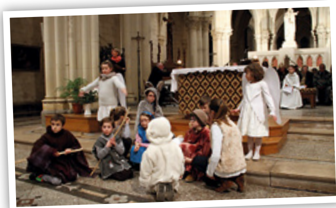
Les bergers et les anges chantent la gloire de Dieu.