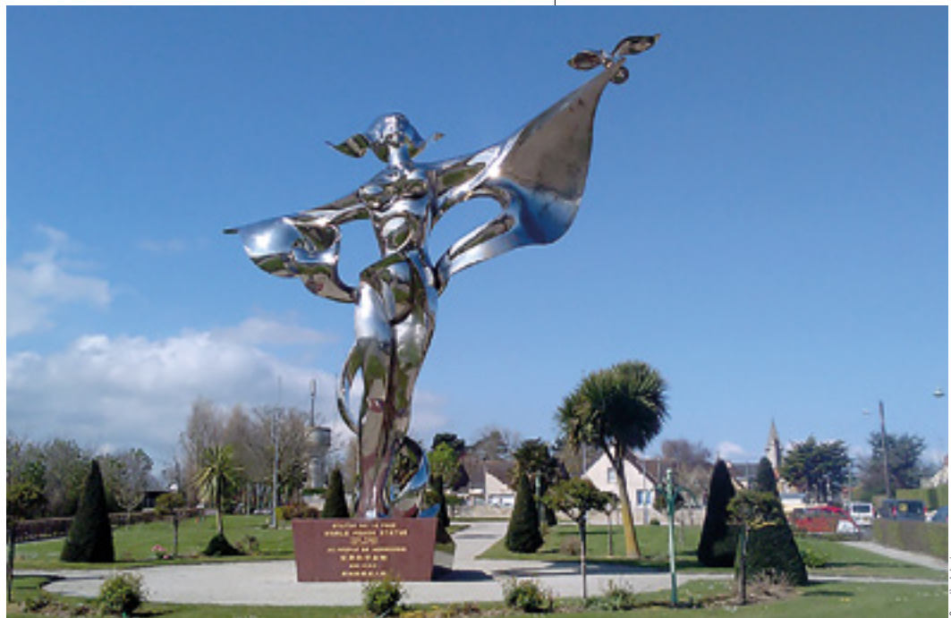
La Paix dans le Monde, une œuvre installée à Grandcamp-Maisy en hommage à la Normandie qui a tant souffert durant la Seconde Guerre mondiale.