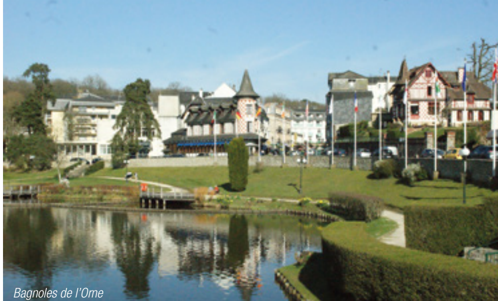
Bagnoles de l'Orne