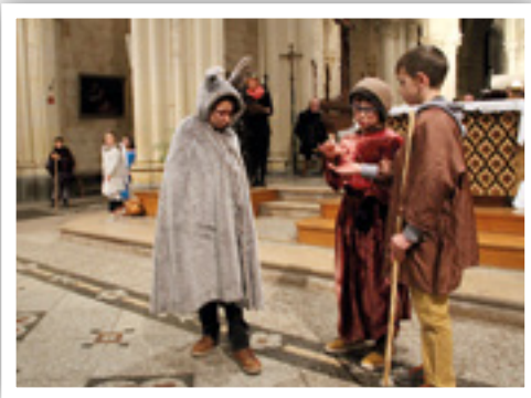
L'âne de Marie et Joseph raconte son histoire.