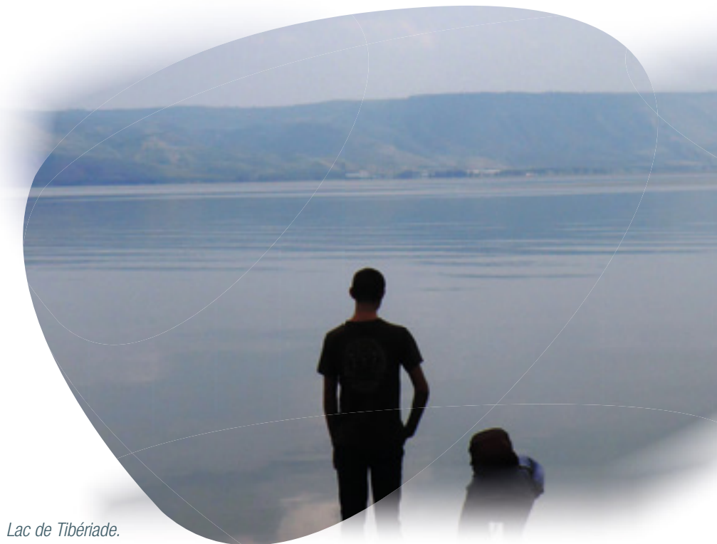
Lac de Tibériade.

L'eau est très présente dans la Bible. La création se fait en rassemblant les eaux "en une seule masse" pour que le monde soit en ordre. Le peuple hébreu n'était pas un peuple marin mais le récit du passage de la Mer Rouge est le grand événement de son histoire.