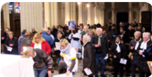
La procession d'entrée avec les bénévoles et les professionnels de la santé.