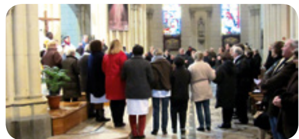
Un moment de fraternité pendant le "Notre Père".