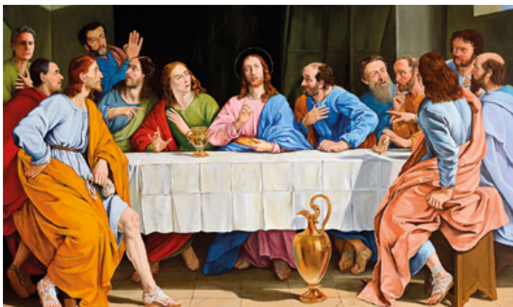
La grande Cène (XVII e siècle) de Philippe de Champaigne.