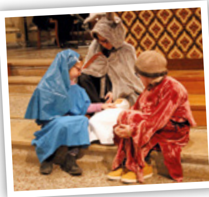
Avec Marie et Joseph, l'âne veille sur l'enfant Jésus.