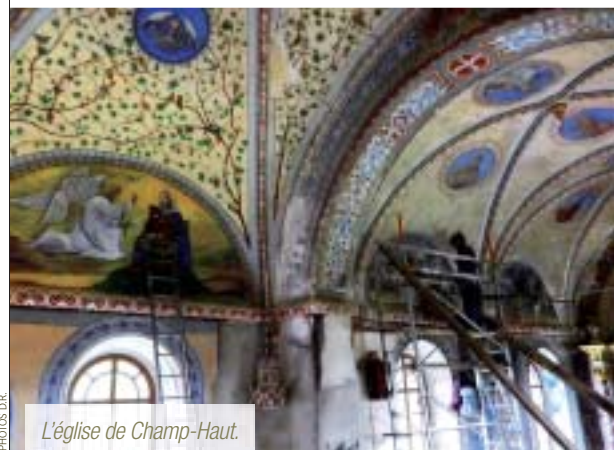
L'église de Champ-Haut.