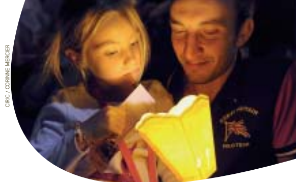
CIRIC / CORINNE MERCIER

Le samedi 17 mai 2014, dans le cadre de la manifestation "Pierres en lumières" l'association de sauvegarde du patrimoine du pays d'Exmes propose une promenade aux flambeaux, de l'église Saint-André à la chapelle Saint-Godegrand - Sainte-Opportune. Départs toutes les demi-heures, de 21 h à minuit. Exposition de vues anciennes du village, à la mairie, de 14 h à minuit.