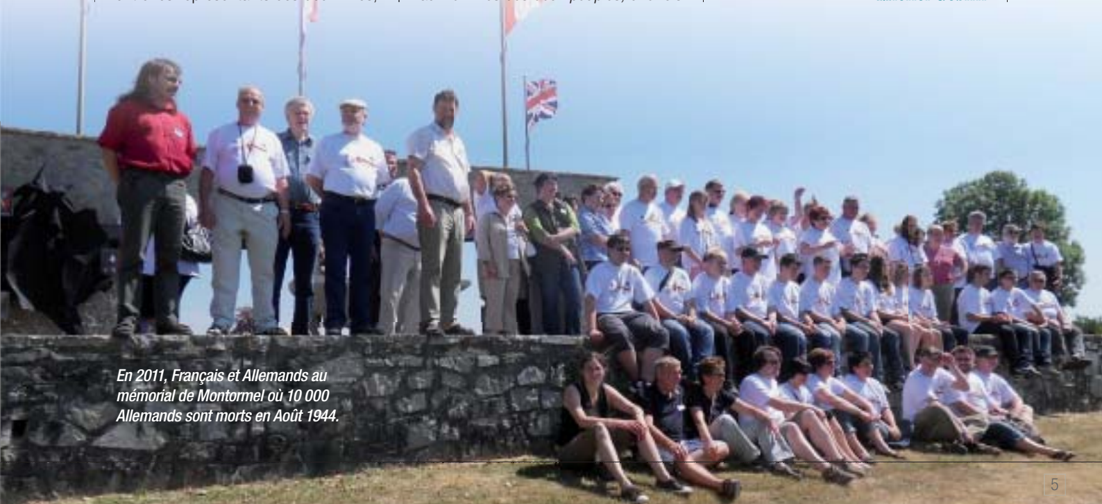
En 2011, Français et Allemands au mémorial de Montormel où 10 000 Allemands sont morts en Août 1944.