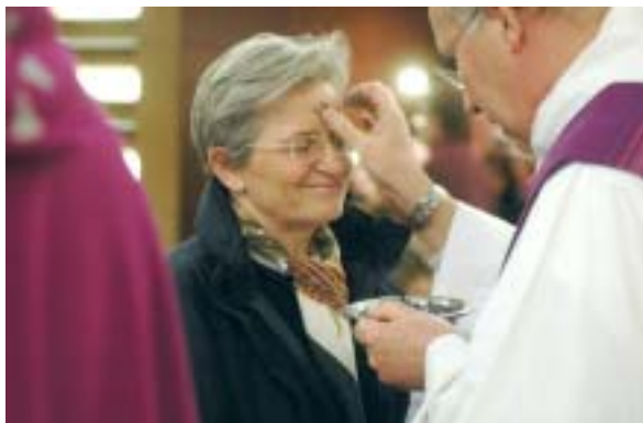
CBRC / ALAIN PINOGES

Vendredi 11 avril à 20 h à la Maison paroissiale.