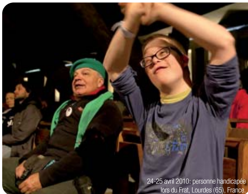
24-25 avril 2010: personne handicapée lors du Frat, Lourdes (65), France.

Osons “être avec” nos frères et sœurs handicapés et les rendre acteurs de la rencontre