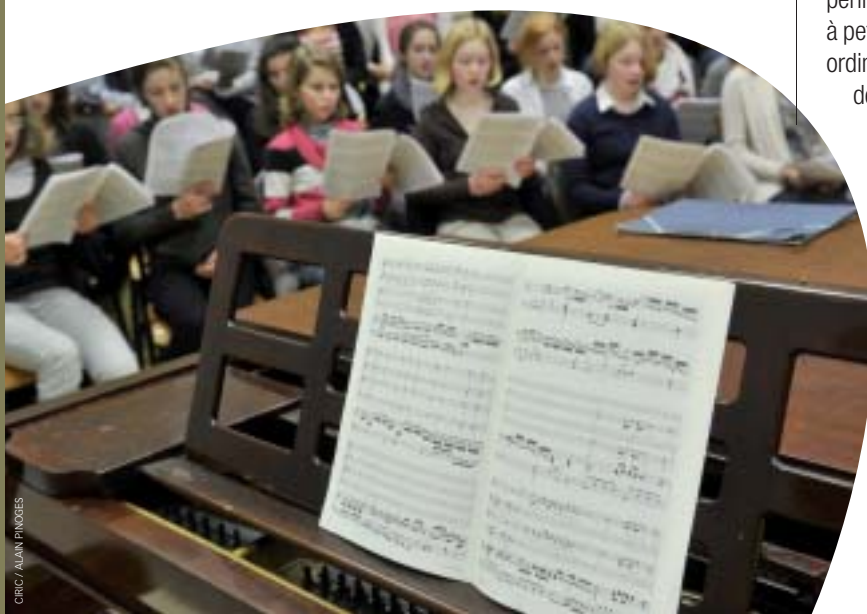
GRIC / ALAIN FROGES

O.S. On aide les enfants à comprendre, par rapport à la foi, leurs questions. Pour moi, cela réactive des choses enfouies. Nous sommes en marche tous ensemble ; on expérimente, nos cœurs se transforment petit à petit. Il se passe des trucs vraiment extraordinaires, par rapport à la compréhension de certains textes de l'Évangile (le berger qui montre le chemin, le centurion au pied de la croix, les disciples d'Emmaüs). On sent que c'est très fort. C'est vraiment profond. On sent que leurs questions ne sont pas des questions en l'air. Le jour de la représentation, tout ce qu'ils ont entendu, ça sort. Il y a une petite flamme qui brille dans les yeux.