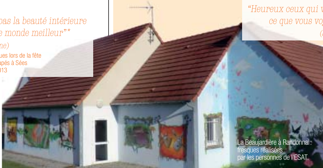
La Beaujardière à Randonnai : fresques réalisées par les personnes de l'ESAT.