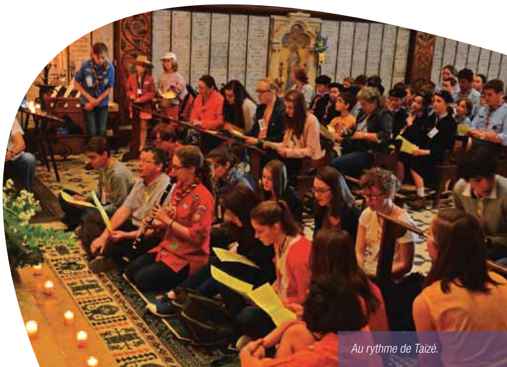
Au rythme de Taizé.