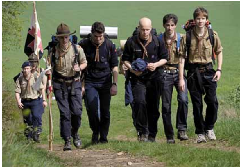
Scouts d'Europe, lors du pèlerinage des jeunes à Chartres (28).

C'est un beau témoignage de foi et d'engagement qui va se vivre sur notre territoire et une belle occasion pour nous de profiter de leur présence dans nos villages et nos paroisses ! Sachons les accueillir dans la joie et nous mettre à leur service pour que ces quelques jours placés sous le signe de l'idéal scout soient une réussite pour tout le monde.