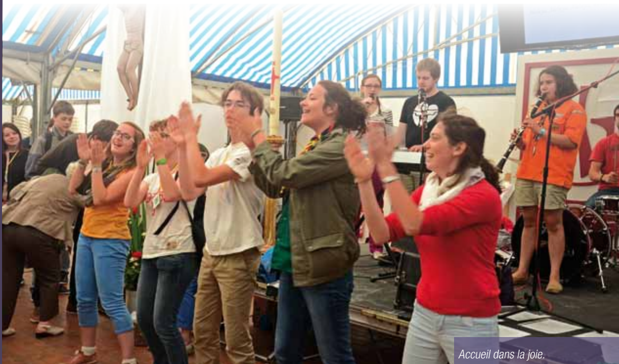
Accueil dans la joie.

Les pages qui vont suivre vous donneront une idée de ce qui a pu se vivre dans les différents ateliers le matin et l'après-midi, du moment convivial autour de la paëlla géante et surtout du temps fort de la célébration de l'eucharistie et de la confirmation présidée par notre évêque qui a clôturé cette journée à 18 h.