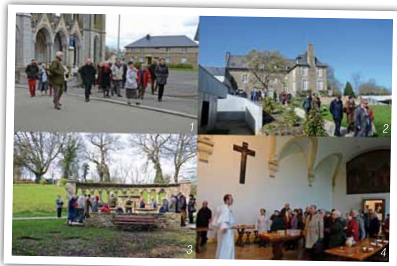
1. Visite à Pontmain - 2. Le foyer de charité de Tressaint . 3. Querrien : lieu de l'appartition. - 4. L'Abbaye de Juaye-Mondaye.