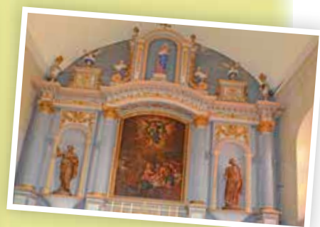
La Sap, son retable Louis XVI et son orgue XIX.

Alors rendez-vous dans ces trois églises à 21 h, 22 h et 23 h, en commençant par celle de votre choix.