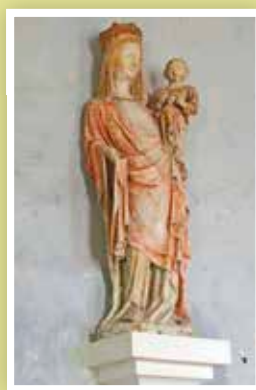
Mise en lumière de la Vierge à l'enfant du XV et des trois retables à Saint-Germain-d'Aunay.