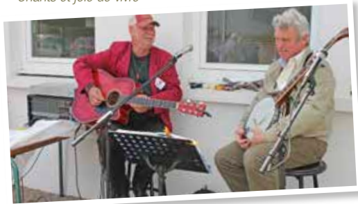
Animation Guitare & banjo, à l'apéritif et dans la journée.