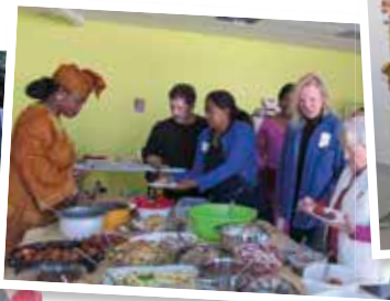
Chacun a apporté une spécialité de son pays