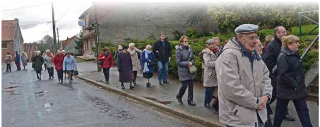
Photos du pèlerinage sur le site www.paroissegacelemerlerault.fr