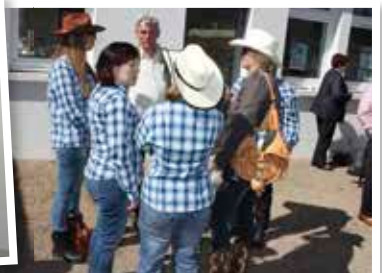
Le groupe "country"