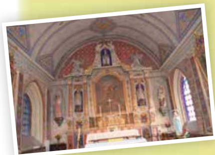
Musique religieuse baroque à Saint-Aubin-de-Bonneval, où on pourra admirer le porche et les retables.