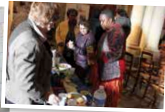
Accueil café pour les personnes venues de loin