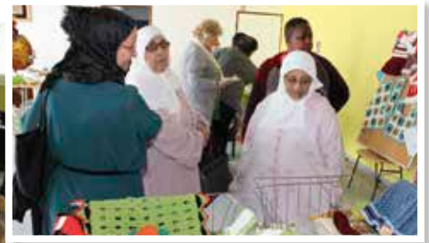
Exposition d'ouvrages de dames marocaines