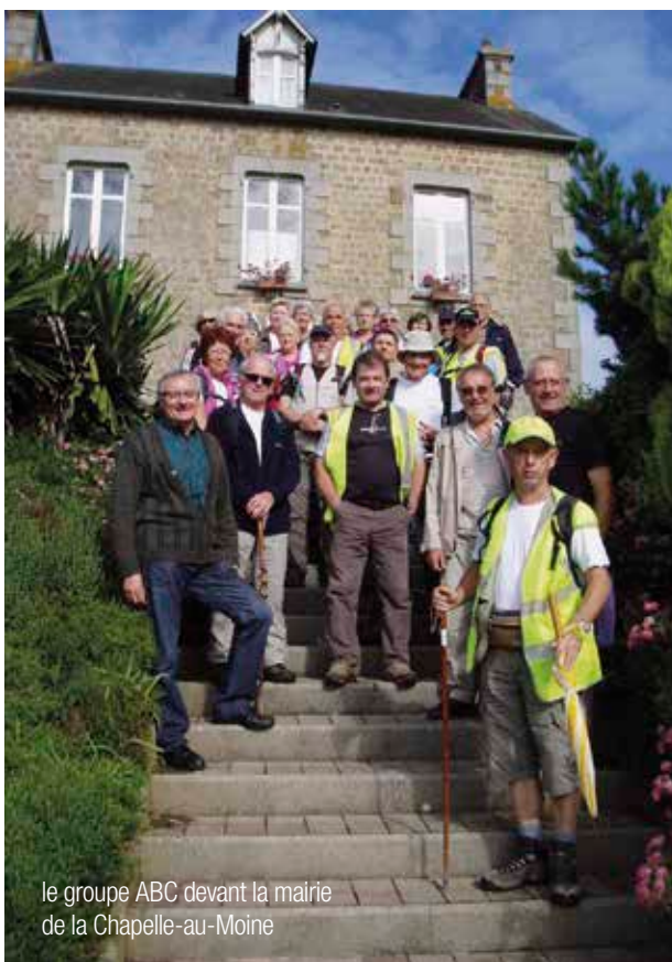
le groupe ABC devant la mairie de la Chapelle-au-Moine

ABC : Association bichoise des chemins de terre, "La Sauvagère" 61100 La Chapelle-Biche Tél. 02 33 65 87 91