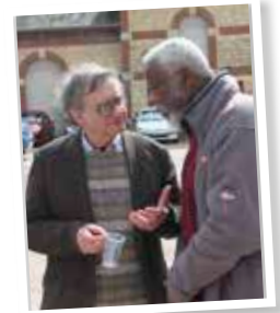
Conférence au sommet