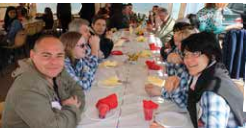
Tous se trouvent une place avant les animations de l'après-midi