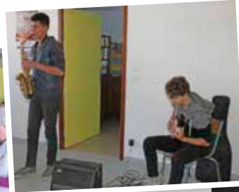
Prestation remarquable et remarquée de deux jeunes musiciens