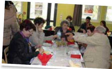
Il était aussi possible de manger à l'intérieur