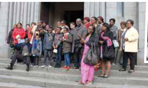
Chants et joie de vivre

d'après-midi. Des sourires, de nouveaux visages, des messieurs qui rejoignent leurs épouses pour le repas et la fête... Retour en images et impressions.