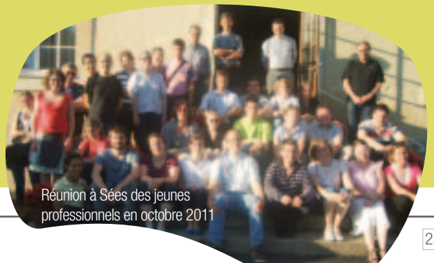
Réunion à Sées des jeunes professionnels en octobre 2011

Il est réellement difficile de trouver du travail, notamment pour les jeunes. J'en ai moi-même fait l'expérience. Le bouche-à-oreille, les contacts et une grande détermination sont nécessaires ; quitte à accepter un emploi qui n'a rien à voir avec la formation initiale. Malgré les difficultés plus ou moins persistantes de la société actuelle, il faut continuer à espérer, vivre de la foi et prier avec toujours plus de conviction, mettre notre confiance en Dieu qui, malgré nos doutes et faiblesses, ne cesse d'agir pour le bien, le beau et le bon. O.