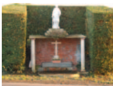
La fontaine Saint-Laurent à la Genevraie

L'église et le cimetière de la Genevraie occupaient jusqu'en 1820 le terrain bordant la fontaine Saint-Laurent, le long de la route de Planches à Talonnai. L'actuelle église a alors été construite en vis-à-vis au nord de cette route. La fontaine Saint-Laurent (diacre, martyr en 258) était en grande vénération dans toute