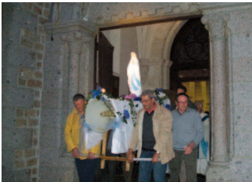
A la Lande-Patry.