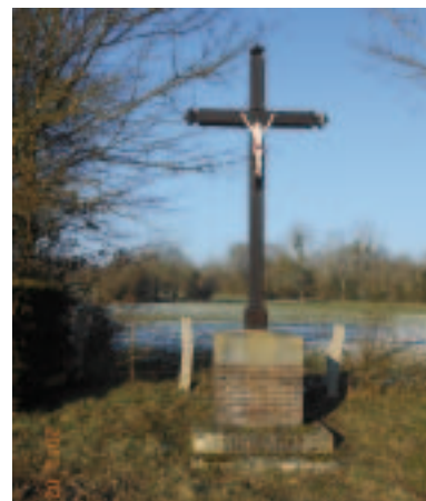
La croix de Carnettes

Le nom de Talonnai apparaît au XIII e siècle sous la forme de La Motte-Talonnai, parce que ce fief était alors possédé par une famille La Motte. L'église était au bord