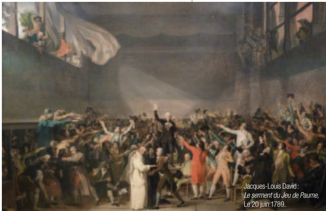
Jacques-Louis David: Le serment du Jeu de Paume, Le 20 juin 1789.