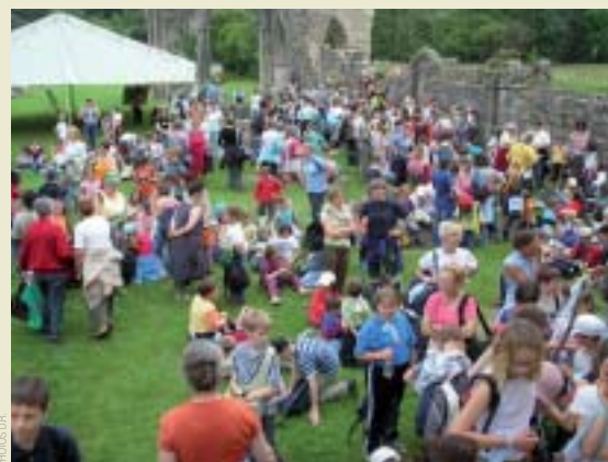
Les enfants à Saint-Evroult

De grands rassemblements sont organisés : en 2000, année jubilaire, 1200 participants pour une journée partage à Saint-Evroult sur le thème "Il était une foi hier, il est une foi aujourd'hui". Le 13 juin 2007, plusieurs centaines d'enfants se sont rassemblés au cœur de la forêt de la Charentone, là où saint Evroult a commencé sa vie monastique.